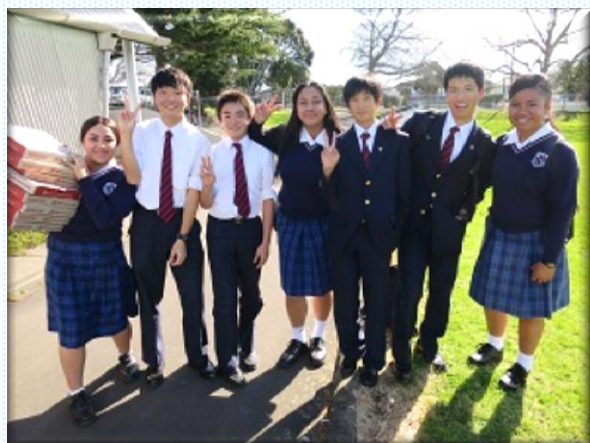
ニュージーランド海外研修（8泊9日）